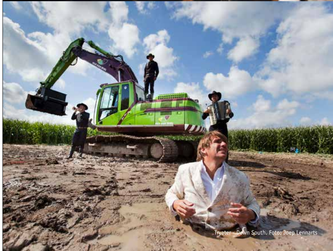
Tryater - Down South.